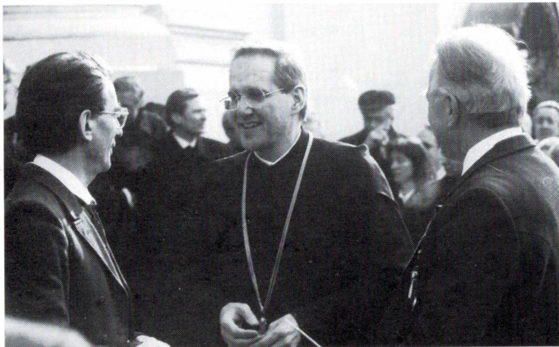
Auszug aus der Kirche

liums, damit wir Ihn schauen dürfen, der uns in Sein Reich gerufen hat». Das ist die Gnadengabe der benediktinischen Berufung; und wenn Ihnen, Herr Abt, heute die Regel überreicht wird, dann geschieht das, damit Sie auf neue Weise Ihre Verpflichtung gegenüber der Regel leben, die vom Evangelium herkommt. Der hl. Benedikt will eine Gemeinschaft als eine Gemeinschaft des Evangeliums, die fähig ist, zu hören.